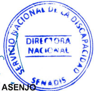
MARÍA XIMENA RIVAS ASENJO Directora Nacional Servicio Nacional de la Discapacidad