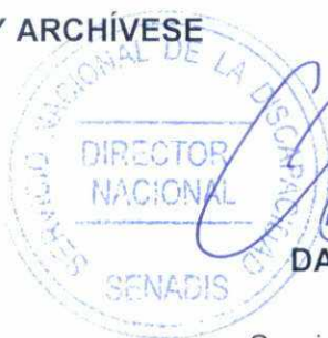
DANIEL CONCHA GAMBOA Director Nacional Servicio Nacional de la Discapacidad