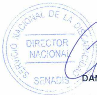
DANIEL CONCHA GAMBOA Director Nacional Servicio Nacional de la Discapacidad