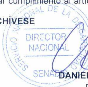
DANIEL CONCHA GAMBOA Director Nacional Servicio Nacional de la Discapacidad