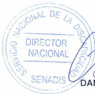
DANIEL CONCHA GAMBOA Director Nacional Servicio Nacional de la Discapacidad