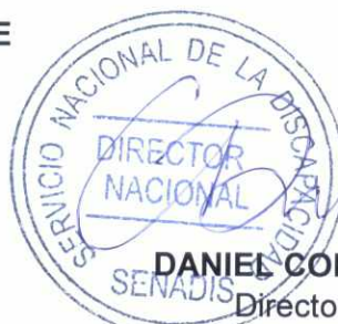
DANIEL CONCHA GAMBOA Director Nacional Servicio Nacional de la Discapacidad